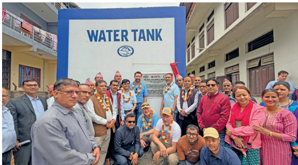
Offizielle Übergabe der neuen Wasserversorgung