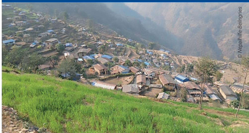
Das Bergdorf Golche im Distrikt Sindhupalchok

Also, lasst uns loslegen! Jeder Euro, den ihr für „School up 3“ spendet, fließt auch wirklich in dieses Projekt in der Landgemeinde Jugal, zu der Golche gehört.“