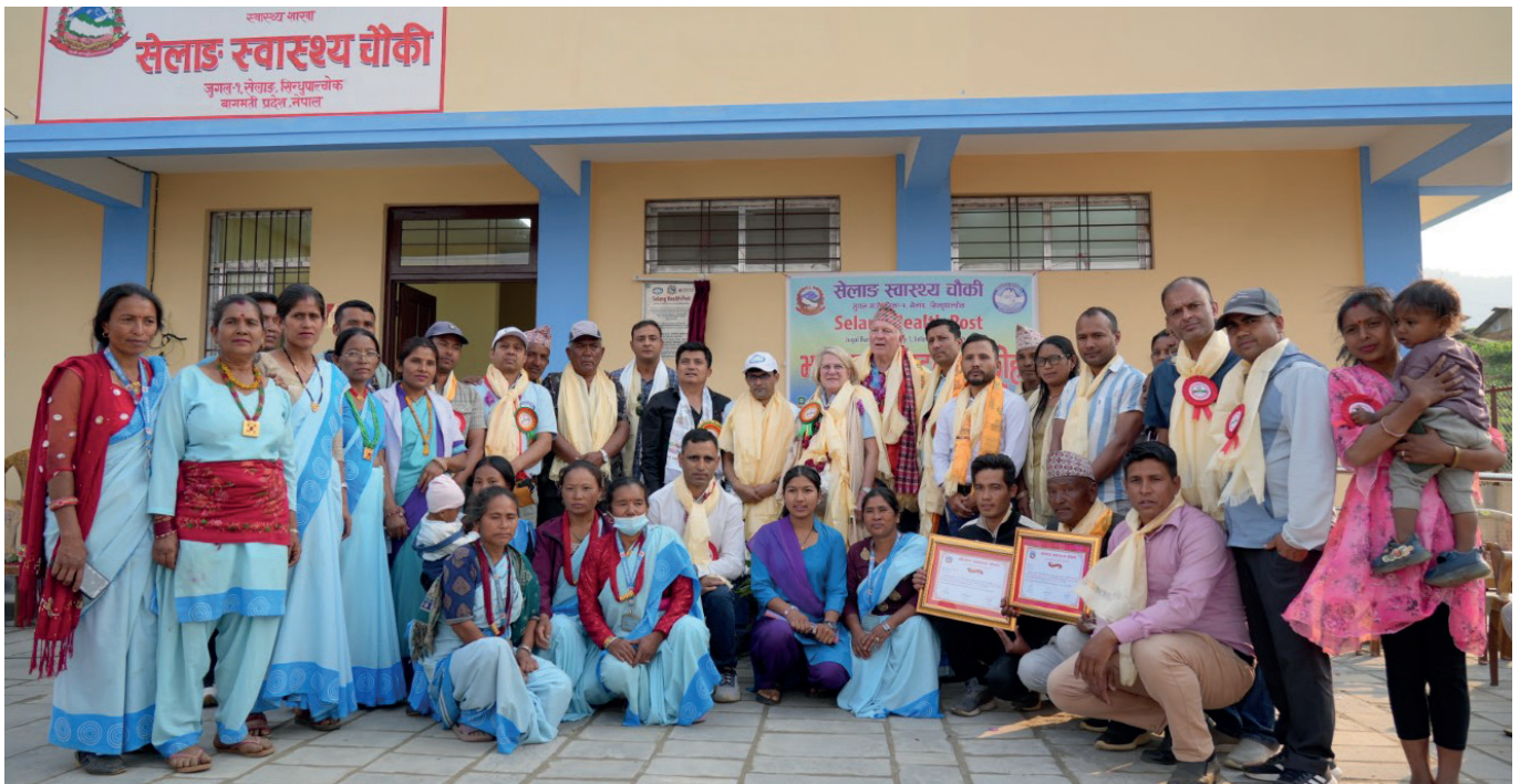
Die Gäste aus Bayern mitten unter den festlich gekleideten Dorfbewohnern