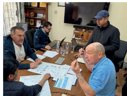
Diskussionen im Office

zukünftig helfen, den Überblick in der Projektverwaltung und bei der Finanzplanung zu verbessern. Wesentlich kurzweiliger war die Übergabe eines gesponserten Augenvermessungsinstrumentes in der Banepa Augenklinik und die einer Laboreinrichtung im Siddhi Memorial Hospital. Der gesamte Wert der Gerätschaften liegt bei rund 100.000 €. Den Abschluss der Reise bildeten die Besuche in der Behindertentagesstätte in Lhubu und dem dortigen Kinderhaus der Nepalhilfe.