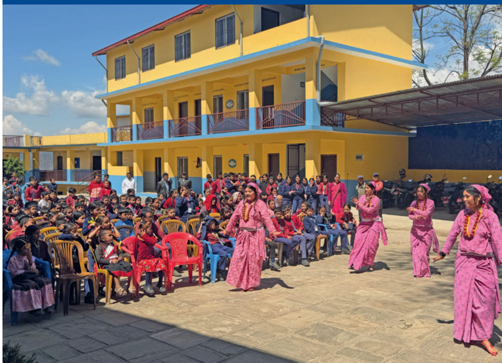
Festlich herausgeputzte Tänzerinnen bei der Einweihung in Sanusiruvari